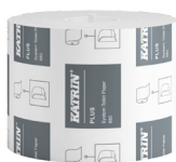
156052 Katrin System Toilettenpapier 680 Blatt 2-lagig