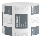
66940 Katrin Plus System Toilettenpapier 800 Blatt 2-lagig