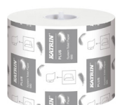
156050 Katrin System Toilettenpapier 680 Blatt 2-lagig